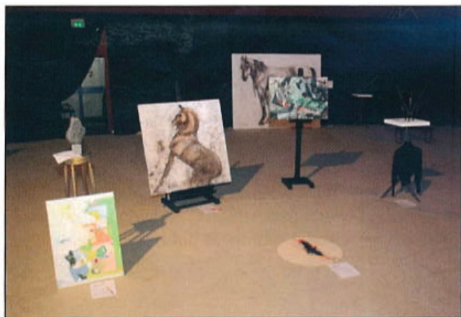
Alcune delle opere in esposizione e messe all'asta